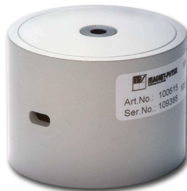
Vergleichsmagnet VM 5

Die Homogenität des VM 5 ist für einen axialen Vergleichsmagnet außergewöhnlich gut. So kann die Feldstärke im Zentrum des Messraums mit einer Unsicherheit von etwa 0,4 % angegeben werden.